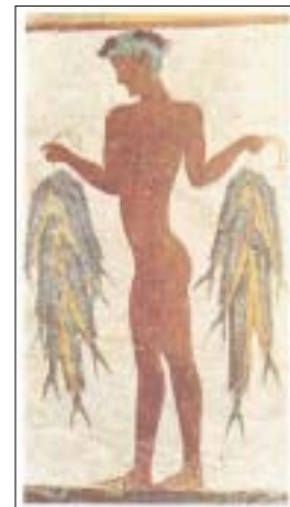
Pescatore. Civiltà egea, II sec. a.C.

Ma attenzione: antichi disegni e immagini dimostrano che l'uomo già da molti millenni, pesca anche per svago e per diletto.