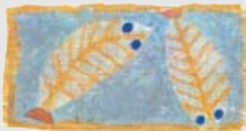
Paul Klee, Pesce dagli occhi blu . Olio su tela di juta, cm.13X24 - 1938