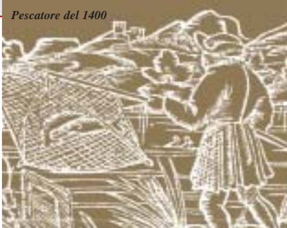
Pescatore del 1400

E' un vigile notturno, molto esigente in fatto di qualità dell'ambiente. Vive sotto le pietre, forse si vergogna delle sue fattezze di piccolo mostro marino... o si vuol salvare dai predatori, dalle forchette e dai vari arnesi appuntiti che lo hanno minacciato per secoli nelle mani di grandi e piccini che partecipavano alla grande festa della "sucia" (asciutta dei navigli). Ormai da tempo, grazie alla cura attenta dei pescatori e della Provincia, l'acqua che rimane nel letto dei canali, lo difende da ogni rischio durante le "asciutte" stagionali.