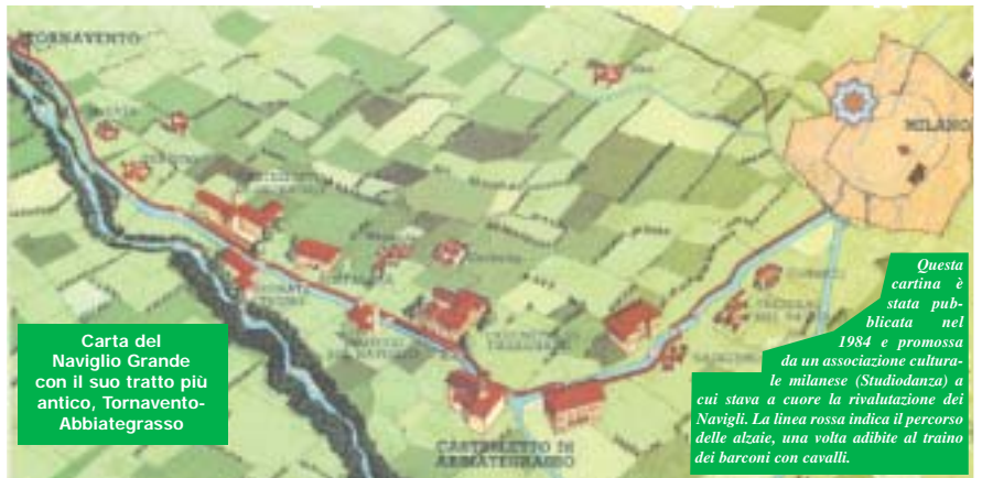
Carta del Naviglio Grande con il suo tratto più antico, Tornavento-Abbategrasso

Questa cartina è stata pubblicata nel 1984 e promossa da un'associazione culturale milanese (Studiordanza) a cui stava a cuore la rivalutazione dei Navigli. La linea rossa indica il percorso delle alzate, una volta adibite al traino dei barconi con cavalli.