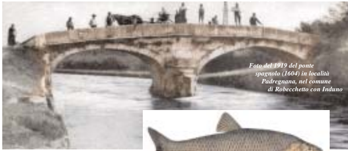
Foto del 1919 del ponte spagnolo (1604) in località Padregnana, nel comune di Robecchetto con Induno